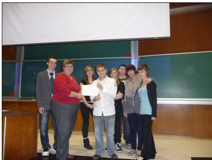
Quelques membres de l'entreprise de Beaurivage lors de la remise du certificat de constitution en société.

Par ailleurs, les jeunes de Beaurivage ont décidé de produire un livre recettes tandis que ceux de Pamphile-Le May fabriqueront des planches à découper.